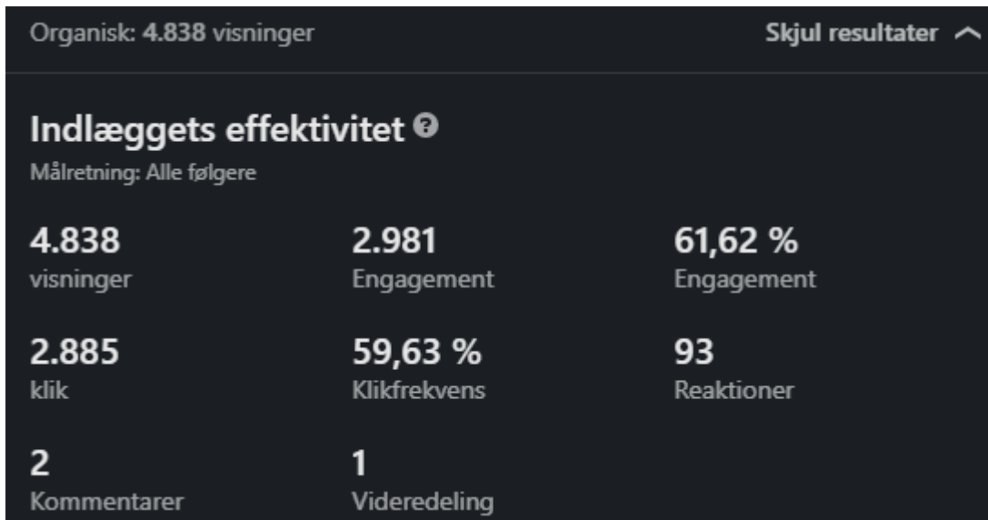
6. Tal fra Danske Maritimes LinkedIn opslag vedrørende Kraka rapporten fra årsmødet 2024.