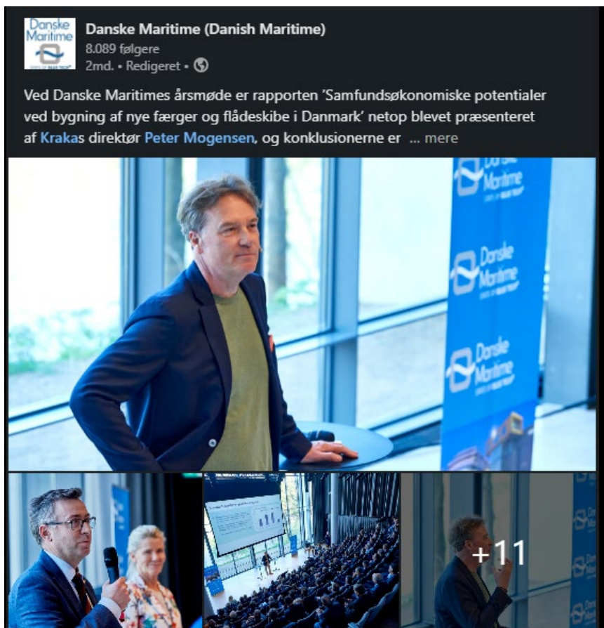
4. LinkedIn opslag angående offentliggørelsen af Kraka Economics' rapport