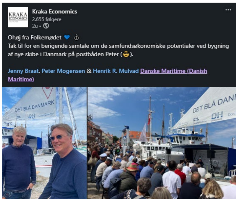
2. LinkedIn opslag om event med Danske Maritime på Folkemødet fra Kraka Economics.